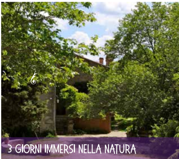
3 GIORNI IMMERSI NELLA NATURA

Sistemazione in camere, colazione, pranzo e cena, pratica Yoga mattutina e pomeridiana.