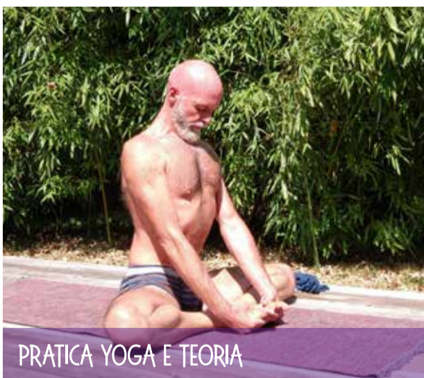
PRATICA YOGA E TEORIA