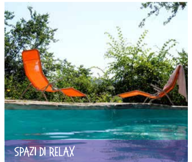
SPAZI DI RELAX