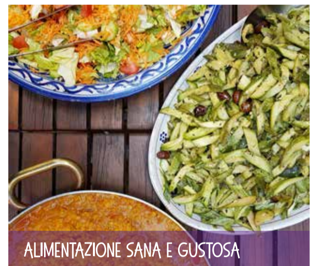
ALIMENTAZIONE SANA E GUSTOSA

Per partecipare è necessaria la prenotazione.